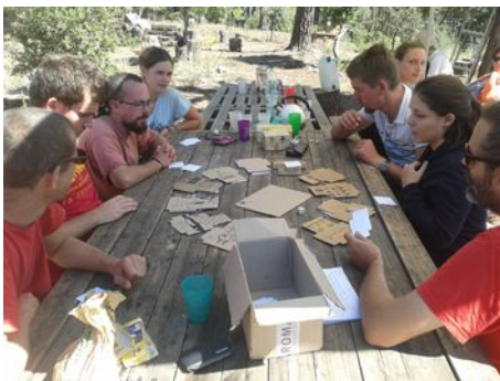
Test des jeux