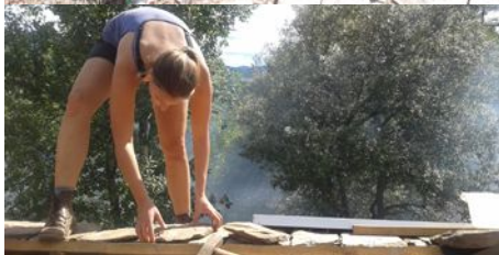
L'approche du faîtage