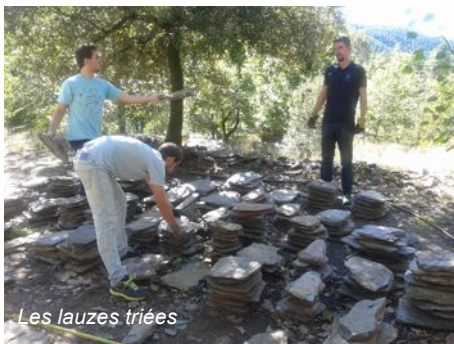
Les lauzes triées