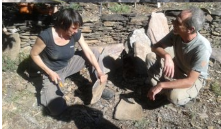
Taille des lauzes