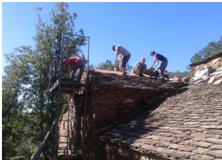
Pose des lauzes