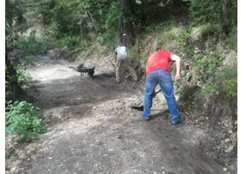
Attaque de la piste à la pioche