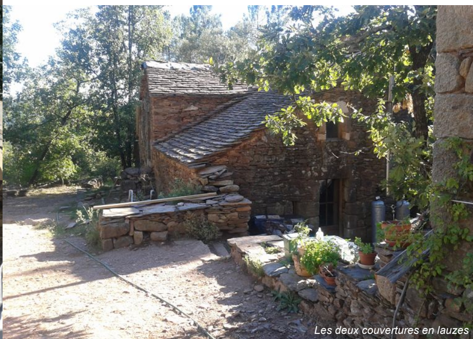
Les deux couvertures en lauzes

Le bâtiment étant composé de petits volumes imbriqués, les faîtages ne pourront être réalisés que lorsque les maçonneries alentours auront été remontées.