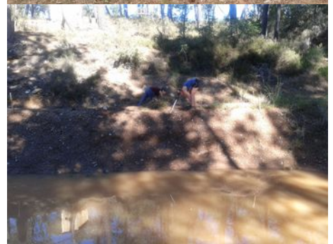
Le nettoyage du bassin