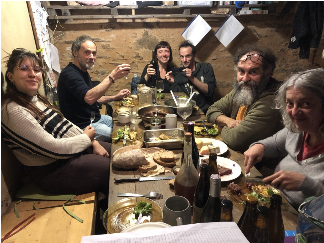
Heureux.ses de boire du bon vin de Kty

Petite archive de photo non utilisées pour le CR :